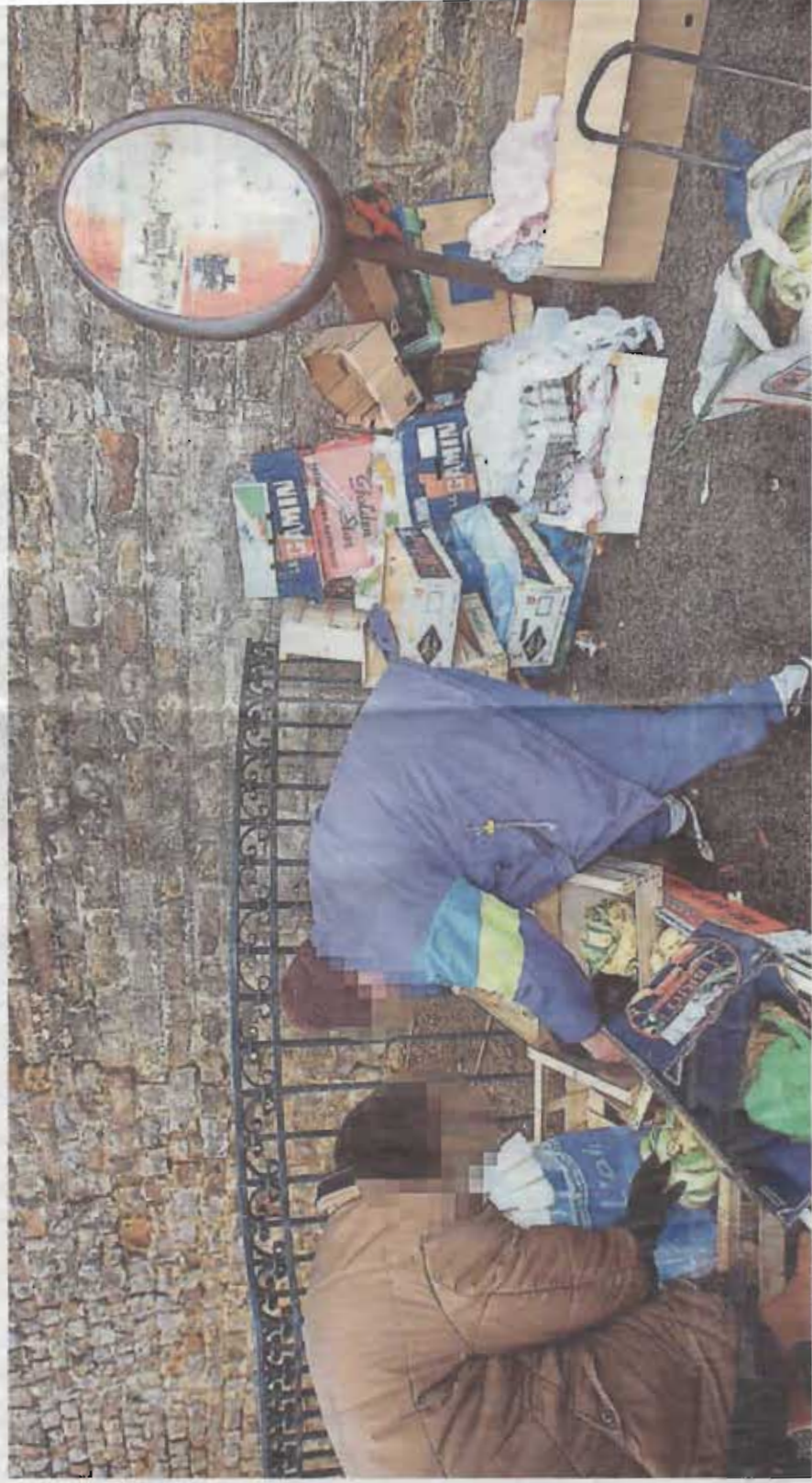
Le Mans, janvier 2009. La Sarthe reste davantage frappée par la pauvreté que les autres départements de la région et c'est ici aussi que les bas revenus sont les plus faibles.

Selon une étude de l'Insee parue hier, la pauvreté serait à la baisse en France. En Sarthe, en tout cas, le taux de pauvreté reste toujours le plus élevé de la région des Pays de la Loire.